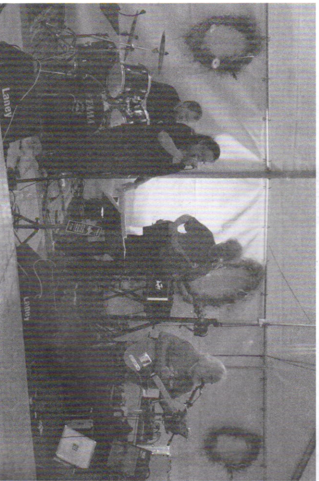
Die Band „Um Himmels Willen“ spielt auf.