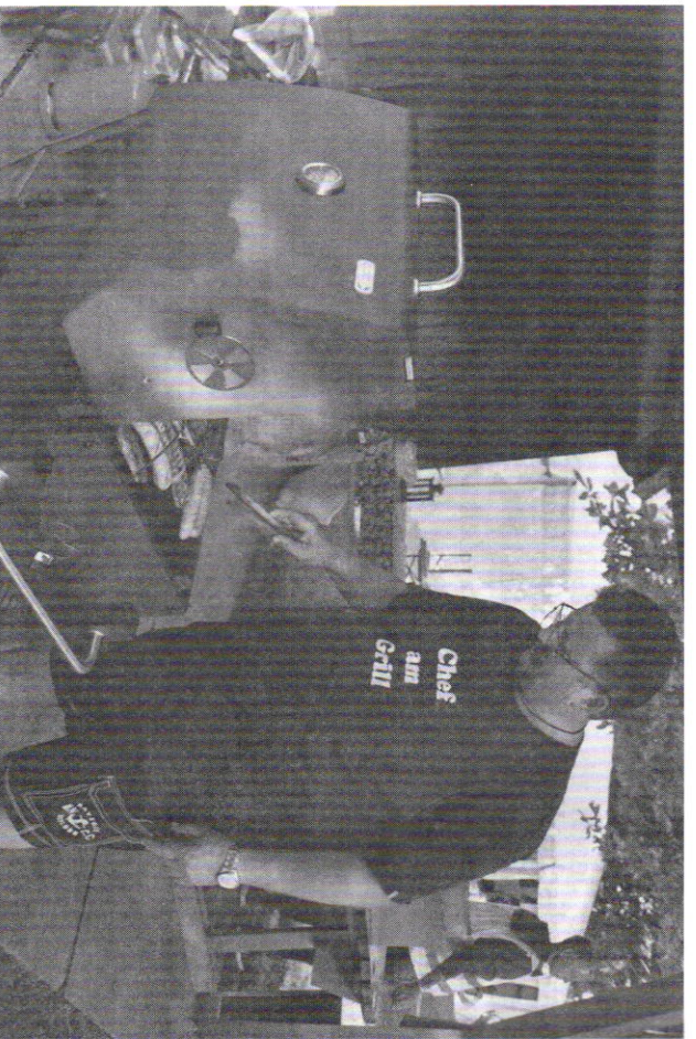
Grillgutvorbereitung zur Band.